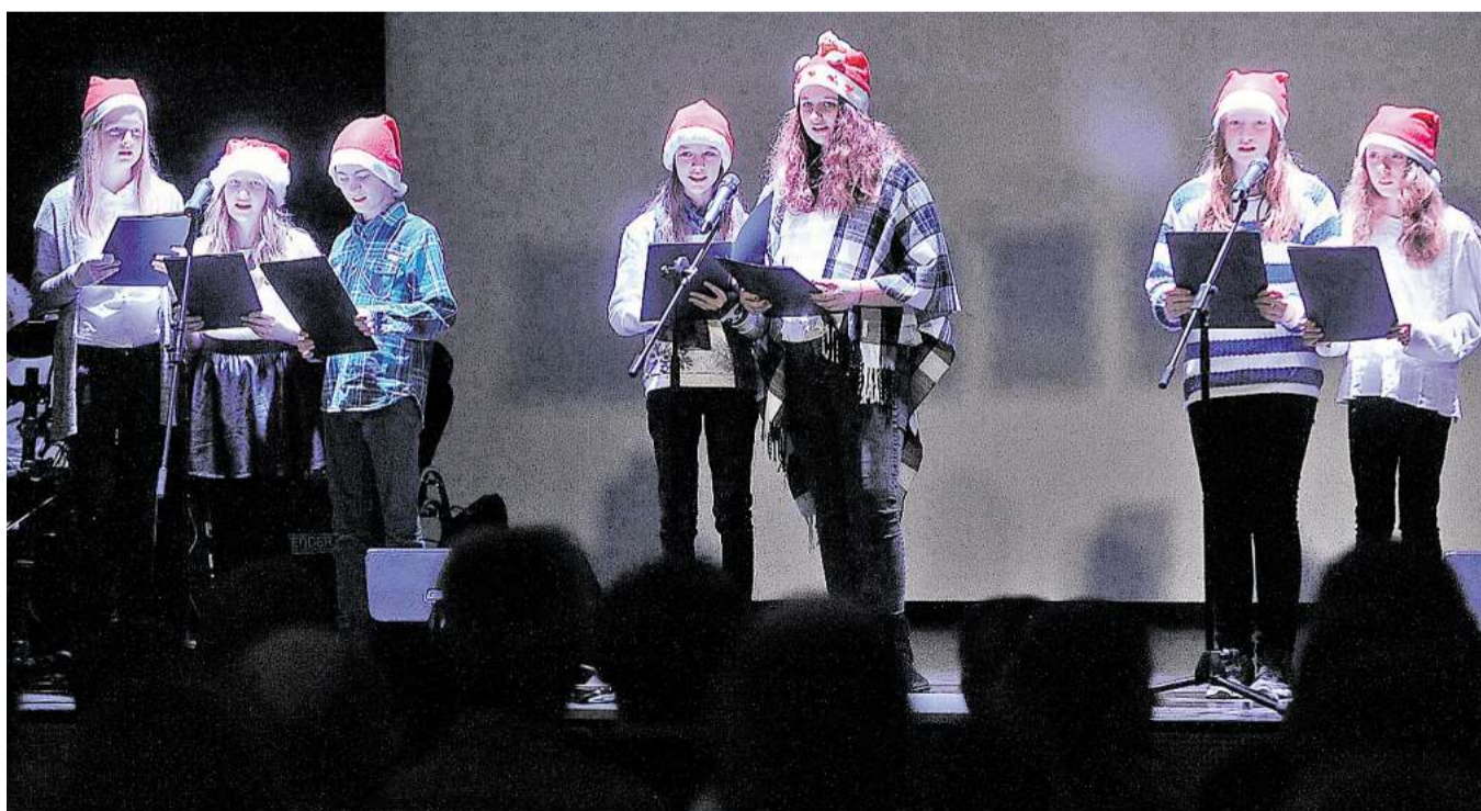
Internationale Weihnachten: Sechst- und Zehntklässler der IGS gestalteten einen fremdsprachlichen Adventsabend.

Westerbeck (rn). Der fremdsprachliche Abend zum Advent hat sich an der IGS Sassenburg mittlerweile fest etabliert. Am Donnerstag war es wieder so weit. Sechst- und Zehntklässler trugen mit ihren Darbietungen auf der Bühne dazu bei. Der Erlös des Abends ist fürs Sprachencafé bestimmt.