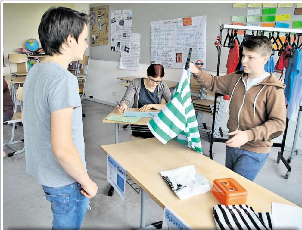
Alles auf Englisch: Im Sportgeschäft ging es darum, ein neues T-Shirt zu kaufen und sich eine Auswahl vorstellen zu lassen. Gezahlt wurde mit englischen Pfund. Chavier

Englisch, Französisch und Spanisch: IGS Sassenburg verwandelt sich zwei Tage in ein Sprachendorf