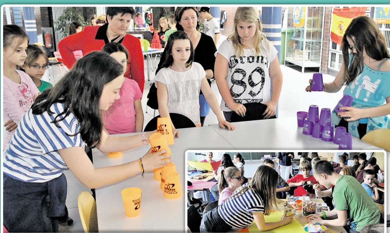
Schnuppertag an der IGS Sassenburg: Viertklässler konnten sich beim Becherstapeln oder auch „Sport Stacking“ (oben) ausprobieren oder eine Pinata basteln. Chavier (2)