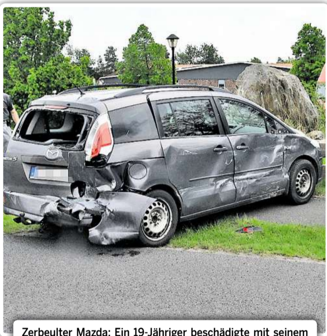
Zerbeulter Mazda: Ein 19-Jähriger beschädigte mit seinem Transporter gestern in Westerbeck mehrere Autos. Chavier

Der 19-jährige Gifhorner wurde vorsorglich in das Gifhorner Krankenhaus gebracht. Drei der vier betroffenen Fahrzeuge mussten abgeschleppt werden. Der Verkehr wurde an der Unfallstelle vorbei geleitet.