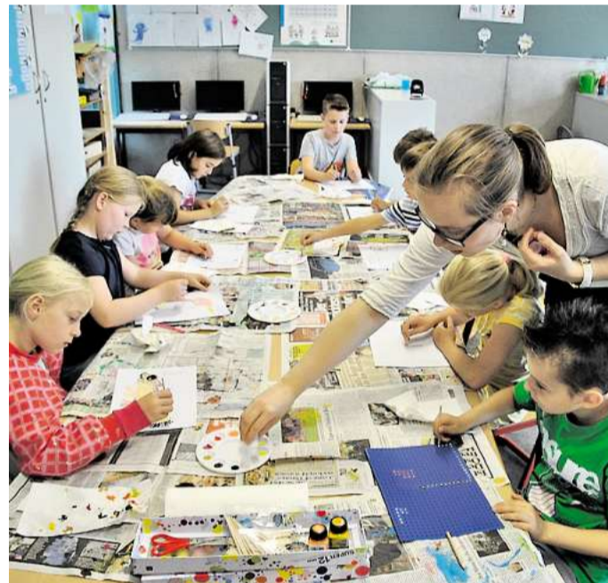
Einladung: Auch das Sommerfest der Sassenburg-Schule steht unter dem Motto: „Eine Erde, viele Länder“. Chavier

Apropos Bühne: „Durch den Neubau ist so eine Veranstaltung überhaupt erst möglich“, so Graumann. Das Sprachen-Café sorgte übrigens fürs Catering. Und die Lehrerband The Educators („Let Me Entertain You“) durfte auch nicht fehlen.