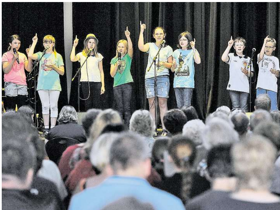
Tanz, Gesang und Musik: Schüler der IGS Sassenburg präsentierten am Donnerstagabend vor großem Publikum, was sie gelernt haben. Ron Niebuhr